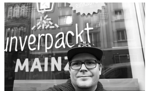
UNVERPACKT MAINZ Heidelbergerfaßgasse 16a Mainz